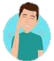
Lelah atau tidak enak badan