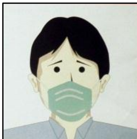
Gunakan masker agar orang lain tidak tertular