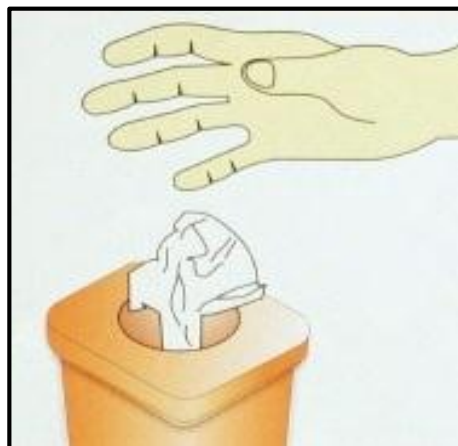
Buang tisu yang sudah digunakan ke tempat sampah