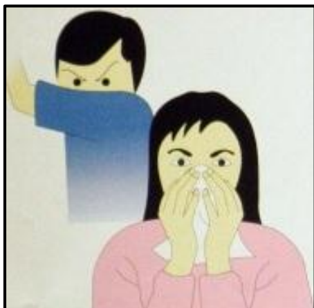
Tutup mulut dan hidung dengan tisu atau lengan baju bila batuk atau bersin

Lalu, bagaimana etika batuk dan bersin yang benar? Berikut caranya :