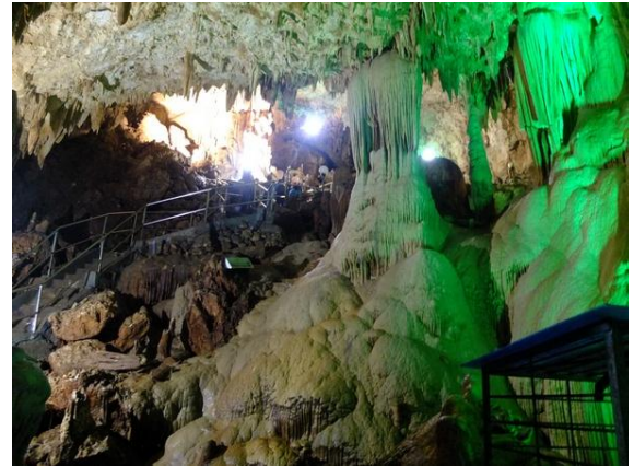
Gua Gong, Pacitan, Jatim Salah satu gua terindah se-Asia Tenggara

Indonesia diperkirakan memiliki kawasan karst yang luasnya mencapai 15,4 juta hektar yang tersebar di beberapa wilayah di Indonesia mulai dari barat hingga timur.