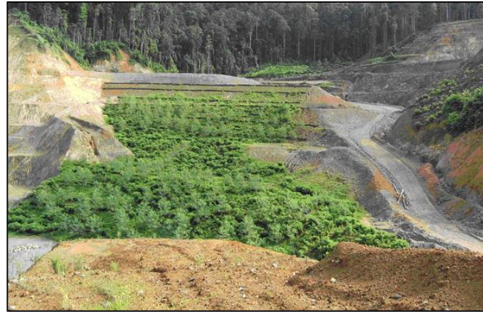
Revegetasi bekas tambang emas di Halmahera Utara, Maluku Utara (Tain dkk., 2005)

Kandungan air dalam lubang-lubang pascatambang pada umumnya mengandung logam berat yang berada di ambang batas, seperti mangan, besi, merkuri, arsenik, dan logam berat lainnya . Apabila dikonsumsi oleh manusia, dapat mengganggu kesehatan secara kronis bahkan dapat memicu kanker.