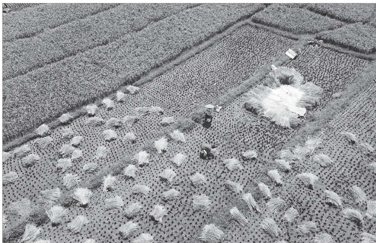
Petani memanen padi di Bogor, Minggu (11/10). Kementerian Pertanian mengklaim bahwa stok beras hingga akhir tahun ini aman. Pada periode Juli hingga Desember 2020, produksi beras yang dihasilkan oleh petani mencapai 12,5 juta ton hingga 15 juta ton dari lahan seluas 5,6 juta hektare.